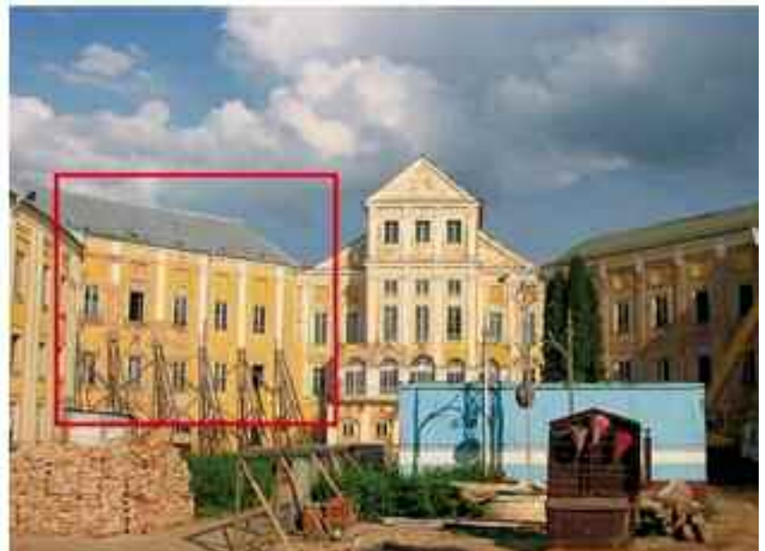
A vivid example of disrespect to the heritage you may see in Nesvizh. The redecorators decided that old wall was not sage enough (that's almost after three hundred years) and disassembled it.

There are lots of examples of destroying very old buildings in Hrodna, there were some protests of citizens as well, which didn't help to stop those barbarians. A vivid example of disrespect to the heritage you may see in Nesvizh. The redecorators decided that old wall was not sage enough (that's almost after three hundred years) and disassembled it. Just see the pictures below: