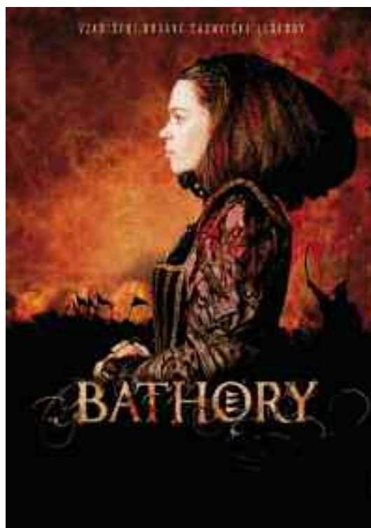
Bathory - dlouho očekávaná novinka Juraje Jakubiska