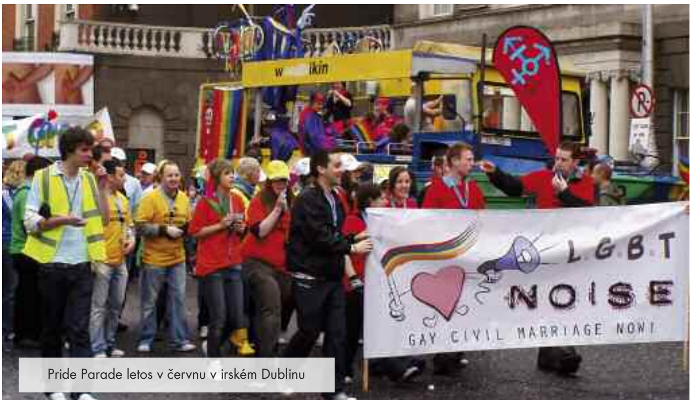
Pride Parade letos v červnu v irském Dublinu