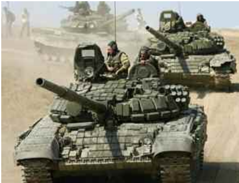
Rusko vpádem do Gruzie porušilo mezinárodní právo

Zdálo-by se, že u sociální demokracie založené na základních hodnotách internacionalismu a multikulturalismu musí geniální zahraničně politické koncepce našeho pana prezidenta, které nejen cizácká EU nedokáže náležitě ocenit, narazit v horším případě na nepochopení, v lepším případě na principiální odpor. Jaké však bylo moje zděšení, když nás média informovala, že proti vládní koalici se v otázce Gruzie postavila trojkoalice ČSSD, KSČM a Václav Klaus. Náš