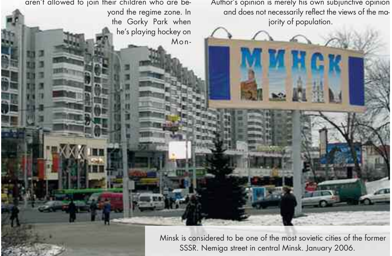
Minsk is considered to be one of the most sovietic cities of the former SSSR. Nemiga street in central Minsk. January 2006.

Author's opinion is merely his own subjunctive opinion and does not necessarily reflect the views of the majority of population.