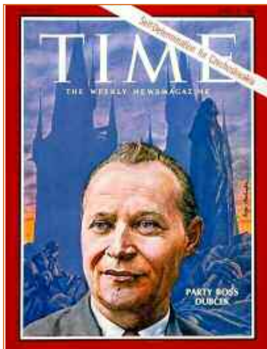
Slovenský dirigent Pražského jara. Dubček na titulní stránce amerického týdeníku Time.

Když jsem byl požádán, abych napsal úvodník k Ventilů věnovaného výročí událostí roku 1968, napadlo mě, zda je vůbec možné přijít s něčím, co o tomto zlomovém roce ještě nebylo napsáno. Zřejmě se již neobjeví natolik zásadní informace, které by kompletně proměnily naše vědomosti o Pražském jaru. Změnit se však může naše vnímání dění nejen samotného osmašedesátého, ale i událostí let šedesátých a to ne vlivem nových historických objevů, ale jak tomu bývá často proměnou nás samotných. V květnu se v Praze konal seminář k pražskému jaru uspořádaný /pokračování na str. 2/