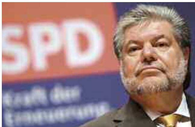
Předseda německé sociální demokracie Kurt Beck má v současné době těžkou hlavu

Ve svých dějinách strana přežila jak rozchod s komunisty, tak Godesbergský program, kdy vize welfare state zvítězila nad konceptem státního plánovaného socialismu, nástup postmoderní levice Zelených i krach SSSR, ale drtivou ránu jí zasadil paradoxně charismatický Gerhard Schröder, který ji vrátil na výsluní, ale za cenu mnoha programových ústupků, které vyústily v odchod 450.000 „modrých límečků“; ti v tichosti vrátili své stranické průkazky a začali si všimnout jiných levicových sil, především nastupující Die Linke.