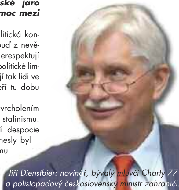
Jiří Dienstbier: novinář, bývalý mluvčí Charty 77 a listopadový československý ministr zahraničí.

všude. Mnozí poctiví nadšenci /pokračování na str. 3/