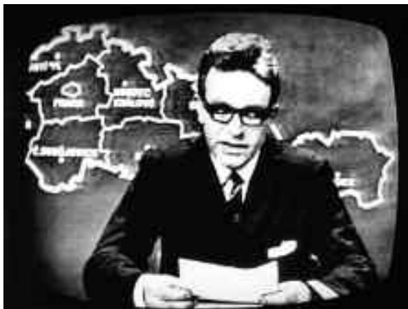
Československé televizní zpravodajství v šedesátých letech.

Po tání z konce padesátých let došlo začátkem sedmdesátých let k „utažení šroubů“, byť mnozí, a to obzvláště přesvědčení komunisté, opustili partaj a vystavili se tak nepříjemnostem. To známe hojně z literatury. Ledy se nakonec nepohnuly. Československý rozhlas stejně jako v době Pražského povstání volal na pomoc. Tentokrát mu nikdo nepřispěchal napomoc. Nakrátko umkl, aby později pokračoval pod poměrně přísným dohledem „poučených“.