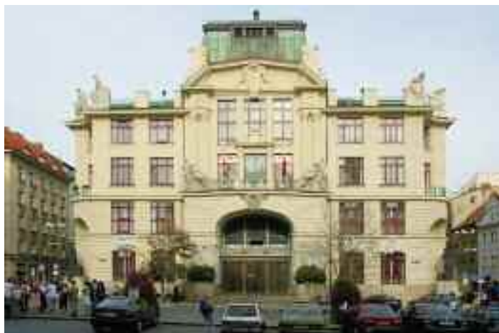
Způsob financování sociální a zdravotní oblasti pražským magistrátem bývá často kritizován.

Než začnu popisovat praktiky pražských zastupitelů ODS, budu se snažit Vám přiblížit financování běžné neziskové organizace. Většina (pražských) neziskových organizací (ze so-