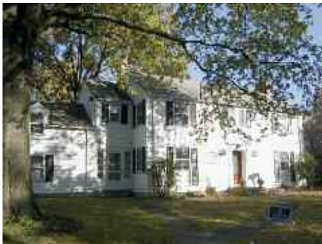
The Sellman's in Bexley, where I stayed

family, the Sellmans. Bexley is a separate municipality that starts around five kilometres outside downtown. It's a very nice area, a garden suburb: tree lined streets and lots of big houses with nice yards. I felt very lucky to be