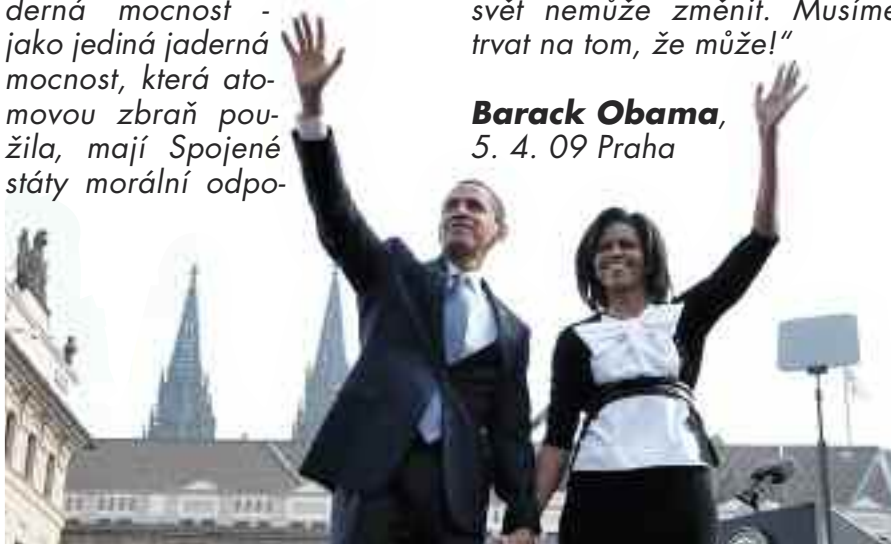
Michelle a Barack v Praze. Více na téma Obama na str. 4