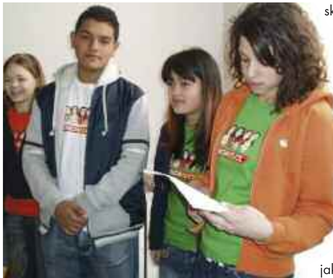
Multikulturní a mezinárodní. Již přes 100 tis. Pražanů se narodilo mimo území ČR.

míra nezaměstnanosti ve skupině osob se základním vzděláním, která činí 19,6 %, což při odhadovaném počtu Romů v Praze znamená 1500 nezaměstnaných. Co se finančního příjmu týká, celou jednu třetinu příjmu u „problémových“ romských domácností tvoří „stálý plat v zaměstnání“, „sociální dávky“ pak zajišťují přibližně srovnatelnou úroveň příjmů. „Důchod“ dostává 15% domácností, „příležitostný výdělek“ má 12% dotazovaných,