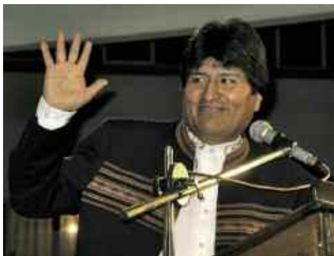
Jedna z nejvýraznějších tváří latino-americké levice: Evo Morales

Levicová a socialistická rétorika uspěla v ultraliberalismem unavené Bolívii, kde původní indiánští obyvatelé z andské vysočiny a amazonských pralesů často žili v podmínkách srovnatelných s rasovou segregací. Indiánům byl