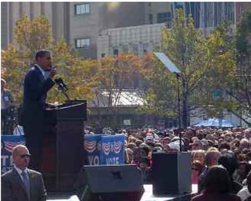
Obama speaking in Columbus

After a day of knocking on doors, I reported back to the Rich Street office, where we watched the first results coming in. Then we headed to the election night party that was organised in a big hotel downtown. When we entered the hotel, we heard frantic cheering upstairs, so we ran there as quickly as we could, to find that Fox News had announced that Obama had won Ohio. We quickly joined the celebrations, as this was basically the final decision: at